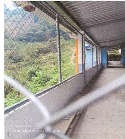
CERCO O MURO PERIMETRAL

Observación: Si es necesario se pueden agregar hojas adicionales y actualizar el número de hojas.